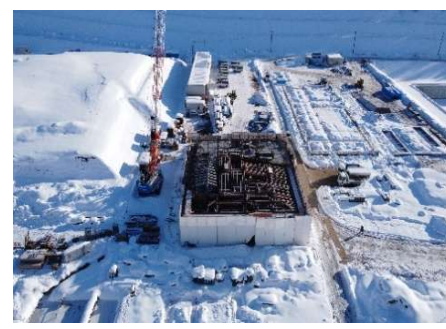
浸出水処理施設（処理棟）