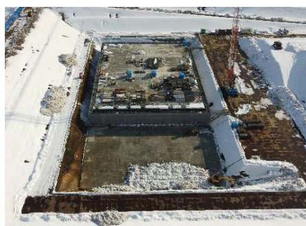
浸出水処理施設（調整槽）