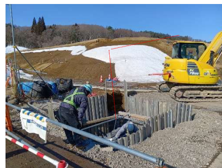
用水路工（マンホール）