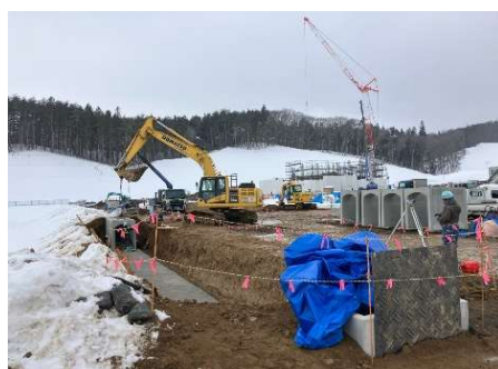
雨水排水設備工（側溝）