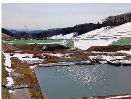
敷地造成工（上流堰堤盛土）